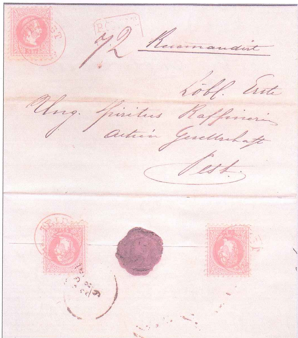
Lettera raccomandata da Trieste per Pest del 3.2.1869 affrancata con 3x5 Kr. (5 di porto e 10 di raccomandazione) annullati con TRIEST con fregio in colore "ROSSO". Non mi sono note altre buste analoghe con questo colore (ben sottovalutato dai nostri cataloghi) mentre lo conosco su altra lettera "sempre" raccomandata dalla collezione del nostro compianto socio Quinto, peraltro in nero. L'annullo è comunque raro, in rosso forse unico.