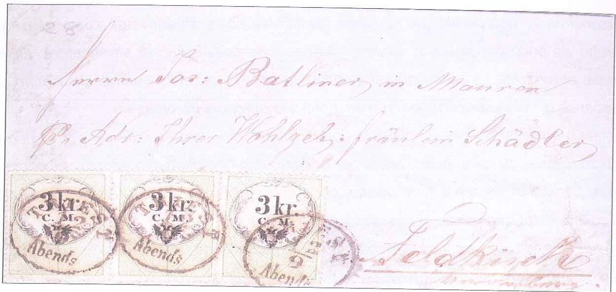
Fig. n° 2 - 12 settembre 1856. Lettera da Trieste per Feldkirch affrancata con striscia di tre marche da bollo da 3 Kr. Giusta tariffa per distanza oltre le 20 leghe.

Prima di chiudere queste brevissime note, ancora una affrancatura particolare : l'impiego delle impronte di interi postali ritagliate e usate come francobolli che sono state normalmente e tacitamente tollerate in ogni periodo ( Fig. n° 3).