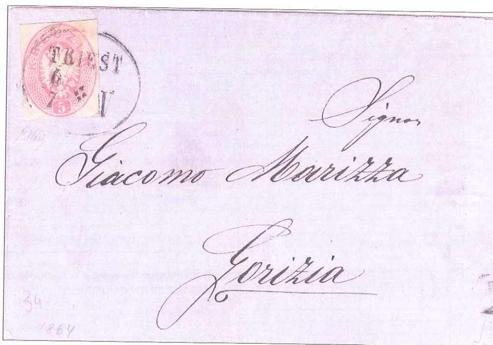
Fig. n° 3 - 6 luglio 1864. Lettera da Trieste per Gorizia affrancata con ritaglio di intero postale da 5 Kr. Giusta tariffa per distanza fino 10 leghe.

Prima di chiudere queste brevissime note, ancora una affrancatura particolare : l'impiego delle impronte di interi postali ritagliate e usate come francobolli che sono state normalmente e tacitamente tollerate in ogni periodo ( Fig. n° 3).